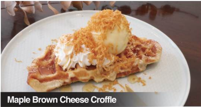
Maple Brown Cheese Croffle