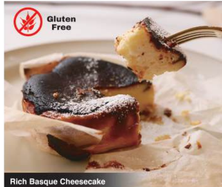
Rich Basque Cheesecake