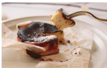
Rich Basque Cheesecake 濃厚バスクチーズケーキ