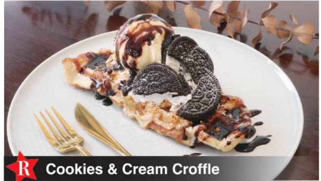
R Cookies & Cream Croffle