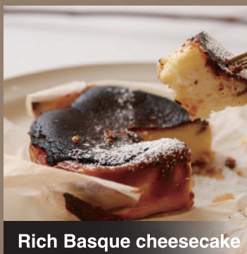
Rich Basque cheesecake