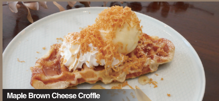
Maple Brown Cheese Croffle