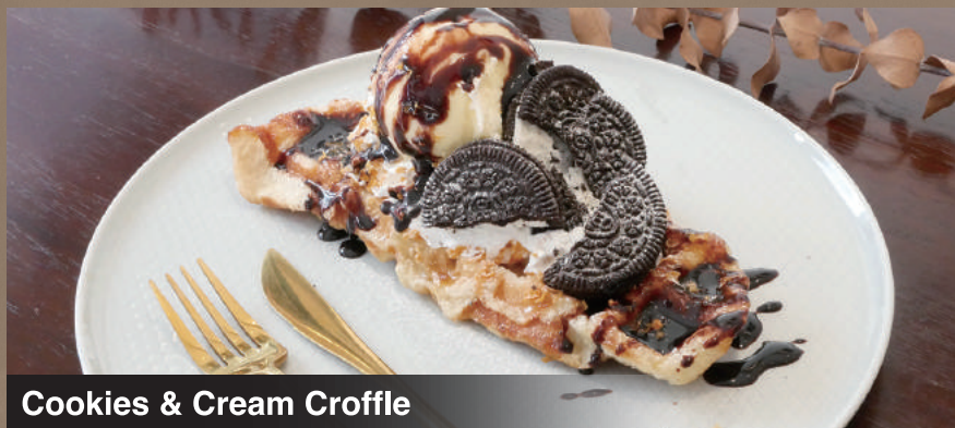
Cookies & Cream Croffle