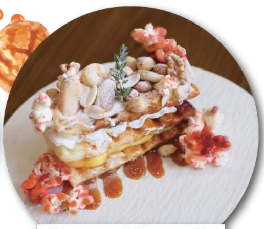
Caramel Nuts Pie