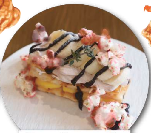
Choco Banana Pie